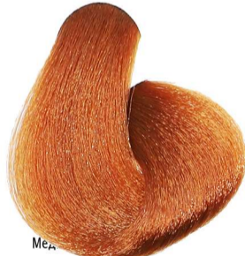
7.4 Biondo Rame Blonde Copper Blond Cuivré Mittelblond Kupfer Rubio Cobre