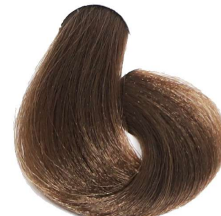
6.0 Biondo Scuro Dark Blonde Blond Foncé Dunkelblond Rubio Oscuro