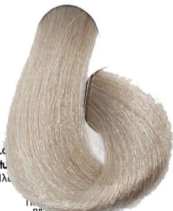
10.01 Biondo Platino Naturale Cenere Blonde Platinum Natural Ash Blond Platine Naturel Cendré Platinblond Leicht Asch Rubio Platino Natural Ceniza