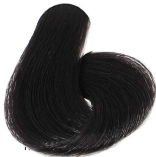
3.0 Castano Scuro Dark Chestnut Châtain Foncé Dunkelbraun Castaño Oscuro