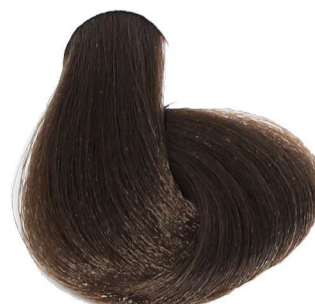
5.0 Castano Chiaro Light Chestnut Châtain Clair Hellbraun Castaño Claro