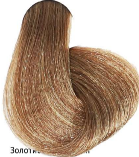
7.3 Biondo Dorato Blonde Golden Blond Doré Mittelblond Gold Rubio Dorado