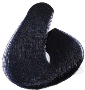
1.10 Nero Blu Blue Black Noir Bleu Blauschwarz Negro Azul