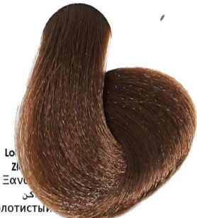
6.3 Biondo Scuro Dorato Dark Blonde Golden Blond Foncé Doré Dunkelblond Gold Rubio Oscuro Dorado