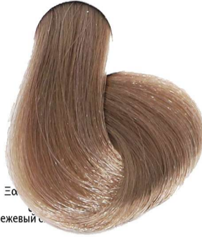
8.32 Biondo Chiaro Beige Light Blonde Beige Blond Clair Beige Hellblond Beige Rubio Claro Beige