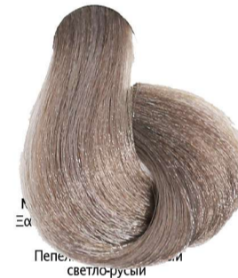
8.01 Biondo Chiaro Naturale Cenere Light Blonde Natural Ash Blond Clair Naturel Cendré Hellblond Leicht Asch Rubio Claro Natural Ceniza