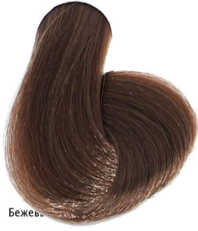
7.32 Biondo Beige Blonde Beige Blond Beige Mittelblond Beige Rubio Beige