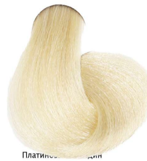
10.0 Biondo Platino Blonde Platinum Blond Platine Platinblond Rubio Platino