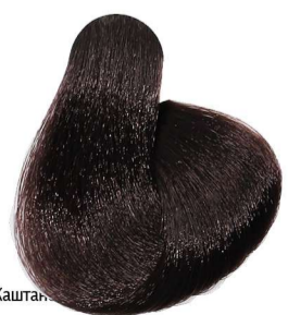
4.7 Castano Marrone Chestnut Brown Châtain Marron Kastanie Mittelbraun Castaño Marrón

Brown_Marron_Braun_Marrón Kasztan_بني_Коричневые_Čokoládové