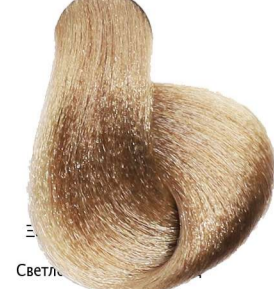
8.7 Biondo Chiaro Marrone Light Blonde Brown Blond Clair Marron Hellblond Braun Rubio Claro Marrón