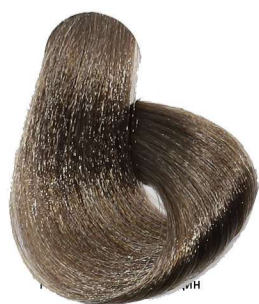
6.31 Biondo Scuro Sabbia Dark Blonde Sandy Blond Foncé Sable Dunkelblond Sand Rubio Oscuro Arena