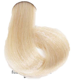
10.32 Biondo Platino Beige Blonde Platinum Beige Blond Platine Beige Platinblond Beige Rubio Platino Beige