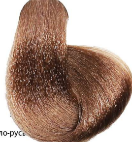
7.7 Biondo Marrone Blonde Brown Blond Marron Kastanie Mittelblond Rubio Marrón