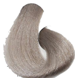
9.01 Biondo Chiarissimo Naturale Cenere Very Light Blonde Natural Ash Blond Très Clair Naturel Cendré Sehr Helles Blond Leicht Asch Rubio Clarísimo Natural Ceniza