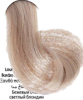
9.32 Biondo Chiarissimo Beige Very Light Blonde Beige Blond Très Clair Beige Sehr Helles Blond Beige Rubio Clarissimo Beige