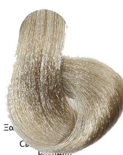
8.31 Biondo Chiaro Sabbia Light Blonde Sandy Blond Clair Sable Hellblond Sand Rubio Claro Arena