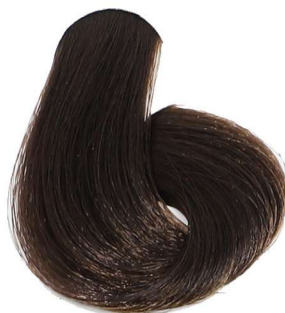
4.0 Castano Chestnut Châtain Mittelbraun Castaño