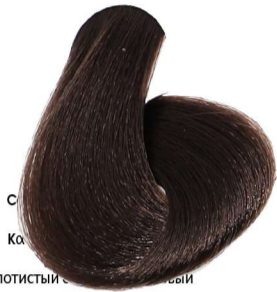
5.3 Castano Chiaro Dorato Light Chestnut Golden Châtain Clair Doré Hellbraun Gold Castaño Claro Dorado

Golden_Dorado_Doré_Gold_Dourado Odcienie Złote_ذهبي_Золотистый_Zlaté