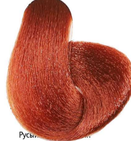
7.46 Biondo Rame Rosso Blonde Copper Red Blond Cuivré Rouge Mittelblond Kupferrot Rubio Cobre Rojo