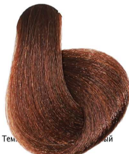
6.34 Biondo Scuro Dorato Rame Dark Blonde Golden Copper Blond Foncé Doré Cuivré Dunkelblond Gold Kupfer Rubio Oscuro Dorado Cobre