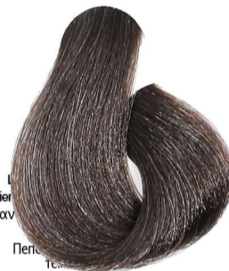
6.01 Biondo Scuro Naturale Cenere Dark Blonde Natural Ash Blond Foncé Naturel Cendré Dunkelblond Leicht Asch Rubio Oscuro Natural Ceniza