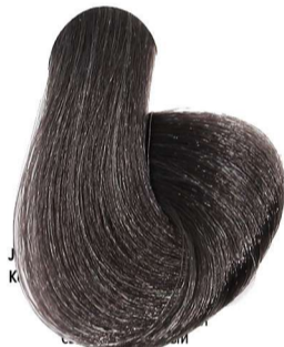
5.01 Castano Chiaro Naturale Cenere Light Chestnut Natural Ash Châtain Clair Naturel Cendré Hellbraun Leicht Asch Castaño Claro Natural Ceniza