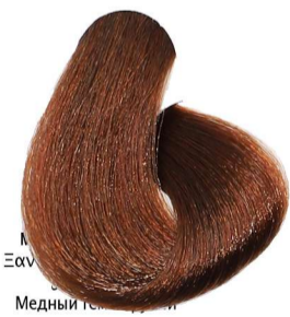
6.4 Biondo Scuro Rame Dark Blonde Copper Blond Foncé Cuivré Dunkelblond Kupfer Rubio Oscuro Cobre

Copper_Cobre_Cuivré_Kupfer_Cobre Odcienie Miedziane_نحاسي_Медный_Мěďené