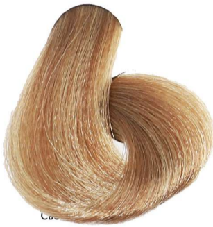
8.0 Biondo Chiaro Light Blonde Blond Clair Hellblond Rubio Claro