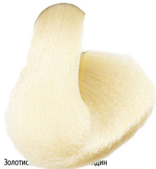
10.3 Biondo Platino Dorato Blonde Platinum Golden Blond Platine Doré Platinblond Gold Rubio Platino Dorado

Golden Copper_Dorado Cobre_Doré Cuivré_Gold Kupfer Dourado Cobre_Miedziano Złoty_ذهبي نحاسي_Золотисто-Медный