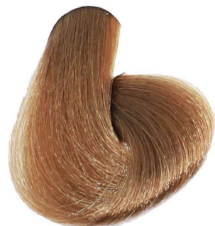
7.0 Biondo Blonde Blond Mittelblond Rubio