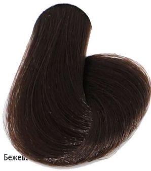
6.32 Biondo Scuro Beige Dark Blonde Beige Blond Foncé Beige Dunkelblond Beige Rubio Oscuro Beige

Beige_Beige_Beige_Beige_Beige Beže_بيج_Бежевы_Бéžové