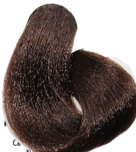
5.7 Castano Chiaro Marrone Light Chestnut Brown Châtain Clair Marron Kastanie Hellbraun Castaño Claro Marrón