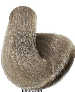
7.31 Biondo Sabbia Blonde Sandy Blond Sable Mittelblond Sand Rubio Arena