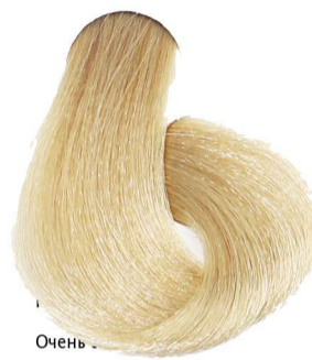
9.0 Biondo Chiarissimo Very Light Blonde Blond Très Clair Sehr Helles Blond Rubio Clarísimo