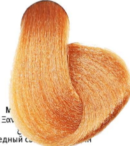
8.4 Biondo Chiaro Rame Light Blonde Copper Blond Clair Cuivré Hellblond Kupfer Rubio Claro Cobre