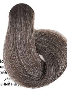
7.01 Biondo Naturale Cenere Blonde Natural Ash Blond Naturel Cendré Mittelblond Leicht Asch Rubio Natural Ceniza