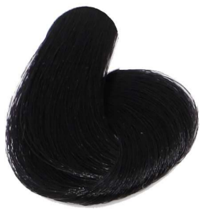
1.0 Nero Black Noir Schwarz Negro