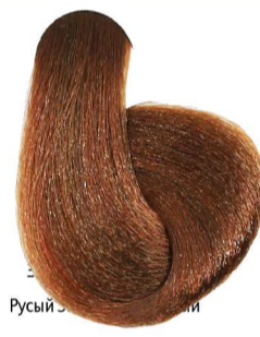
7.34 Biondo Dorato Rame Blonde Golden Copper Blond Doré Cuivré Mittelblond Gold Kupfer Rubio Dorado Cobre