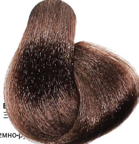
6.7 Biondo Scuro Marrone Dark Blonde Brown Blond Foncé Marron Kastanie Dunkelblond Rubio Oscuro Marrón