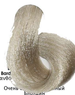
9.31 Biondo Chiarissimo Sabbia Very Light Blonde Sandy Blond Très Clair Sable Sehr Helles Blond Sand Rubio Clarísimo Arena