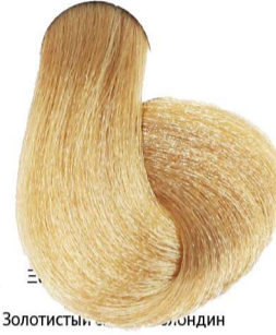
8.3 Biondo Chiaro Dorato Light Blonde Golden Blond Clair Doré Hellblond Gold Rubio Claro Dorado