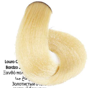
9.3 Biondo Chiarissimo Dorato Very Light Blonde Golden Blond Très Clair Doré Sehr Helles Blond Gold Rubio Clarissimo Dorado